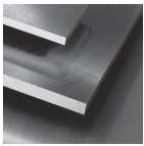
Éco-Präz* [Éco] L: 500 mm