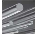
Präzisionsrundstahl mit Bearbeitungsaufmaß [PRS/BA] / 1.2360 mod. geschält / überdreht L: 500 mm L: 1'000 mm