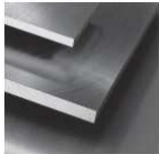
€co-Präz* [€co] L: 500 mm