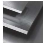
€co-Präz* [€co] L: 500 mm