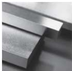
Präzisionsflachstahl mit Bearbeitungsaufmaß [PFS/BA] L: 500 mm L: 1'000 mm