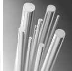
Rundaluminium [RA] gepresst L: 500 mm L: 1'000 mm